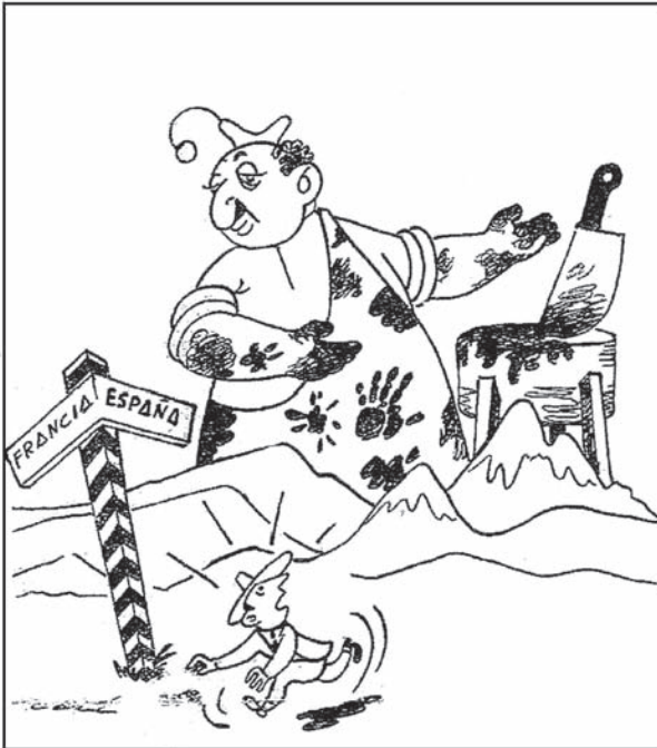
EL ABRAZO DEL OSO

—¡Mis brazos están abiertos para recibir los que tengáis las manos limpias de sangre!