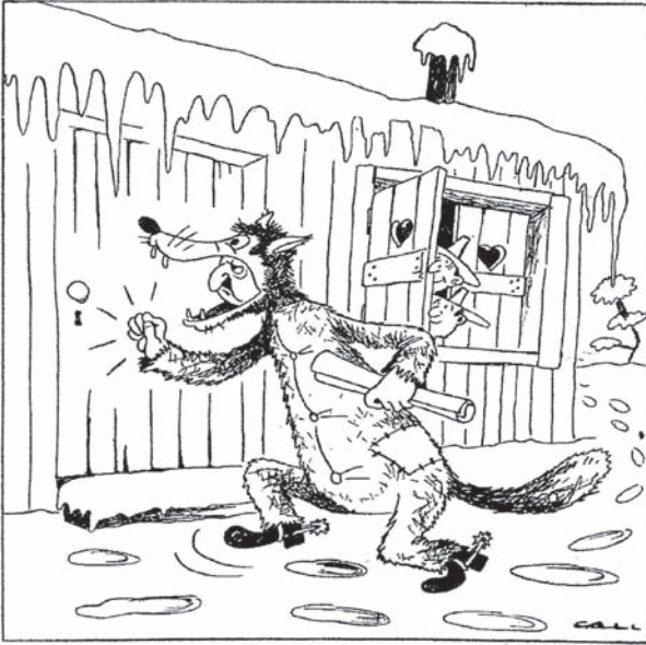
EL «LOBO FEROS»

—¡Salid, caperúctas rojas! ¡Os traigo la «amnistía»!